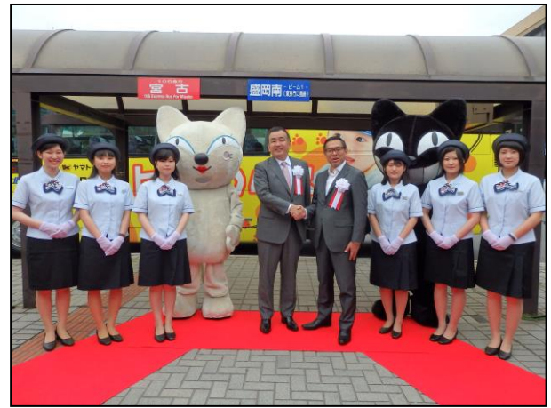
岩手県北バスのバスガイドとヤマト運輸のキャラクター「シロネコ、クロネコ」に囲まれ握手する長尾社長（中央左）と松本社長（中央右）